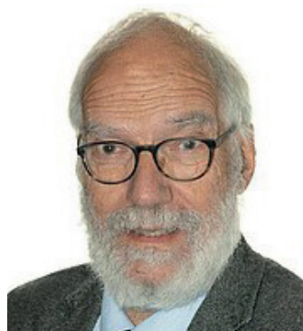
Für den Vorstand des Northeimer Konzertrings

Wir wünschen Ihnen einen erlebnisreichen 77. Konzertwinter!